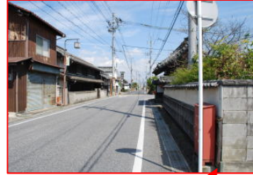
生活道路。歩道はない。同じ幅の道路であるが、右は路側帯をカラー舗装しているため、歩きやすい。金田池は向かって左にあるため、道路を横断する必要あり