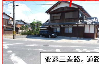
変速三差路。道路対面に渡るため注意必要