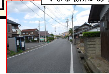
生活道路。歩道はない。道幅は狭くなる場所があり注意必要