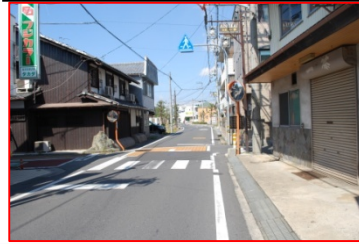
生活道路。歩道はない。