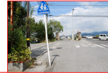
橋の手前から道路幅が広がる。橋は左にのみ歩道橋があるので、かなり手前で左に横断する必要がある