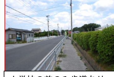
小学校の前のみ歩道あり。