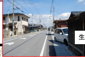
生活道路。歩道はない。