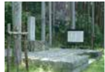
66 諸木野関所跡 街道を歩く人から通行料を徴収する目的で15世紀中頃に街道の各所に関所が設けられた