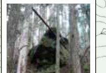
74 姫隠岩 仁徳天皇に追われた連総別王が恋人の女鳥王を岩陰に隠して追手から逃れたという伝説が残る