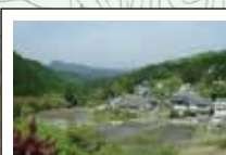
70 愛宕神社前からの眺め 振り返れば眼下に諸木野集落が広がる