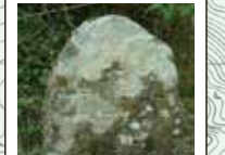
71 宇陀ヶ辻の道標 内牧から平井を経て菟田野(古市場)や大字陀(宇陀松山)へ通じる