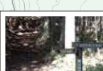
三郎岳・高城山へ 三郎岳(878m)は宇陀市の最高峰で山頂は360度の展望が開ける。高城岳(810m)を経て赤埴方面へ下る宇陀市のハイキングマップあり。ちなみに太郎岳は俱留尊山(1038m)で次郎岳は住塚山(1009m)(石割峠手前の道標)