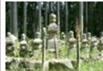
67 諸木野弥三郎の墓 弥三郎は、弓の名将で、国司の命により宇陀や大和の武将の動きを大河内城へ報告する役目を担っていた