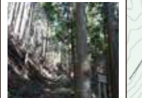
72 石割峠 伊勢本街道の最高地点 695mを越える