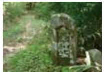
73 笹原の道標 「右いせ 左原山道」と刻む宝暦3年建立。右へ細い道を下る