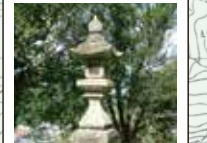
69 太神宮燈籠 明治22年(1889)の建立。この集落から曾爾村山柏まで約10.2Kmトイレなし