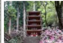
原山から室生寺へ 笹原の道標を直進すると原山の集落を経て県道を川沿いに下ると約7Kmで室生寺へ(室生寺 五重塔)