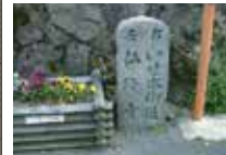
68 諸木野の道標 近世にはここに多くの旅籠があった。「右いせ本街道 左仏隆寺」平成2年建立