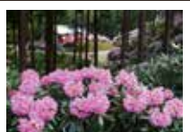
弁財天シャクナゲの丘

県道を南へると約2Kmで国道369号へ。すぐに左の旧国道を2Kmほど行くとトンネルの上に弁財天シャクナゲの丘がある。見頃は5月上旬