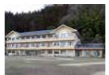
上田口から室生寺へ

榛原駅から一日の行程は曾爾村山粕までが一般的だが、シャクナゲや紅葉の季節には、ここから室生寺や弁財天を訪ねるのはいかがだろうか。事前に帰りのバス時刻をチェックして、ひと味違う街道歩きを楽しもう。