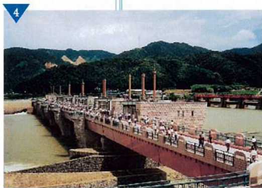
▲九頭竜川鳴鹿大堰建設整備(完了)