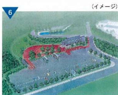
▲「道の駅」の整備(予定)