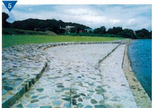
▲九頭竜川河川環境整備(進行中)