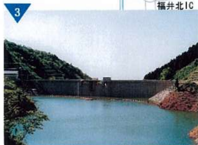
▲永平寺川ダム建設整備(完了)