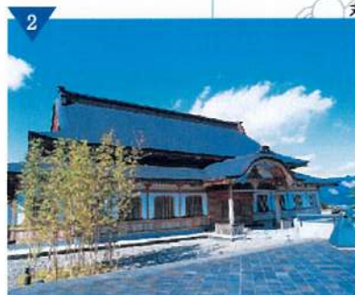
▲四季の森文化館施設整備(完了)