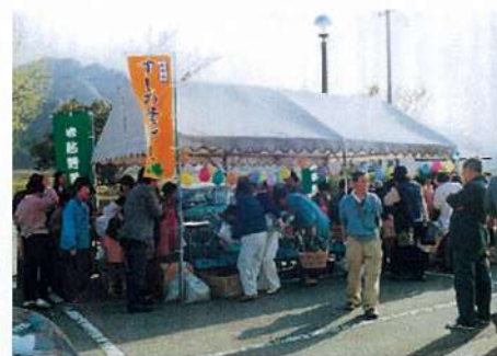
▲地元の新鮮な野菜や特産品が並ぶ野菜市