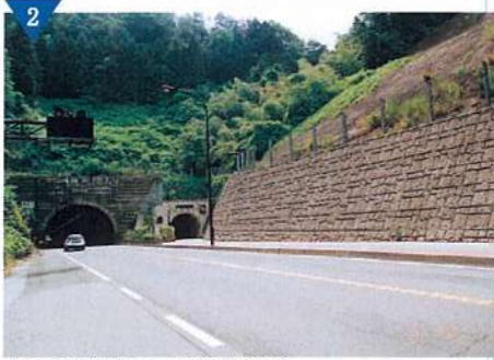
▲佐和山歩道トンネル整備（完了）