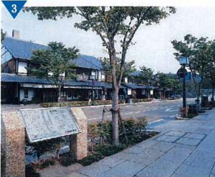
▲城下町の雰囲気を活かした街並み整備「夢京橋キャッスルロード」（完了）