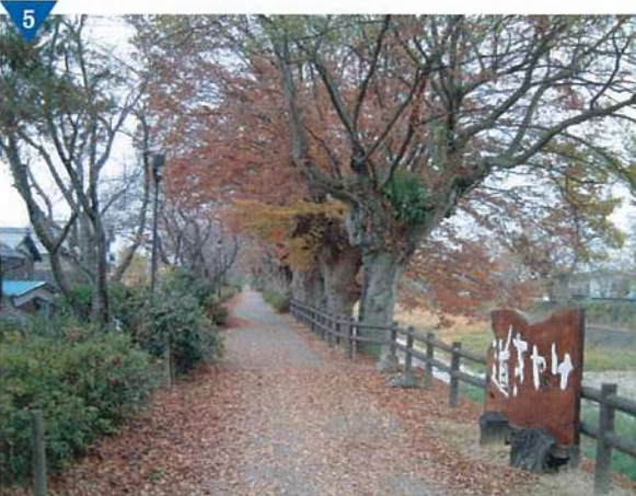
▲「芹川堤げやきみち」修景整備（完了）