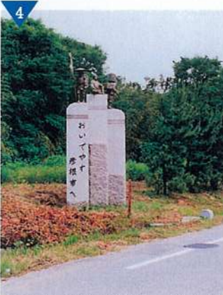
▲私のまち案内板設置（シティゲート設置）（完了）