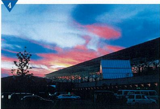
▲道の駅の整備「ガレリアかめおか」(完了)