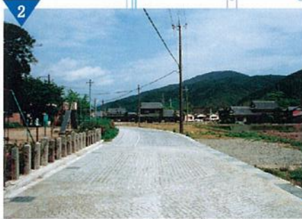
▲伝説と緑香る古道「市道古大道線」整備(完了)