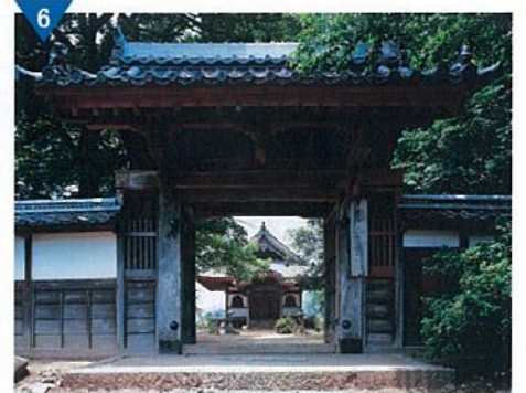
▲国の史跡に指定される「丹波国分寺」の整備(進行中)