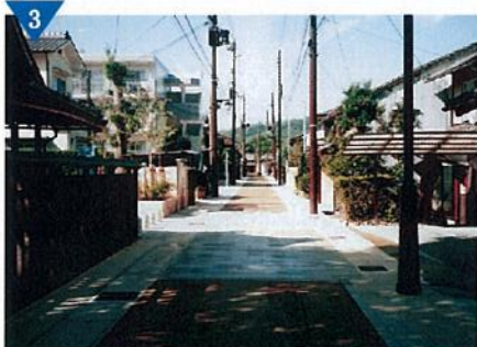
▲歴史的街並みと個性あるまちづくり「市道京町線」(完了)